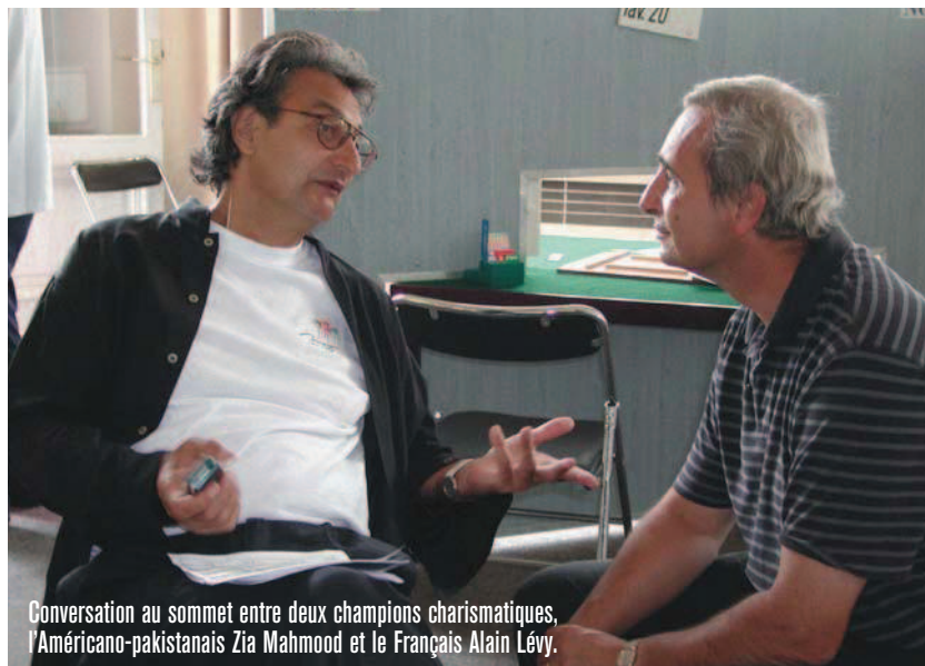
Conversation au sommet entre deux champions charismatiques, l'Américano-pakistanaï Zia Mahmood et le Français Alain Lévy.

toutes les mains supérieures à 21H, mais de nombreuses lacunes dans la zone de 16 à 19H.