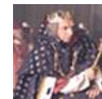
Sa Majesté Point d'Honneur