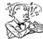
Le Compte en Flanc