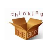
Principe de la boîte