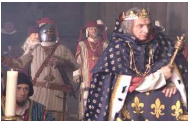
Sa Majesté Points d'Honneur