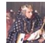
Sa Majesté Point d'Honneur