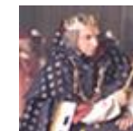
Sa Majesté Point d'Honneur