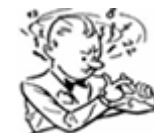
Le Compte en Flanc